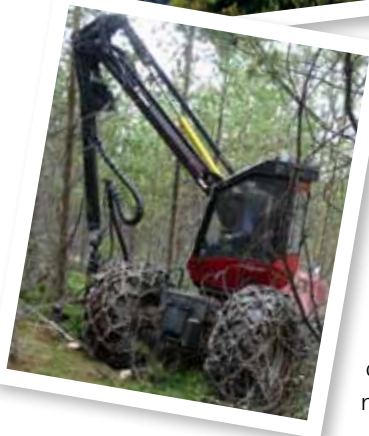
SCA er Europas største private skovejer.

slutbrugere faktisk mere var kvinder med inkontinens end bygningskonstruktører og snedkere. Cellulosen er vigtig, og derfor var opmærksomheden under turen mere rettet mod produktiviteten end mod tømmerkvaliteten.