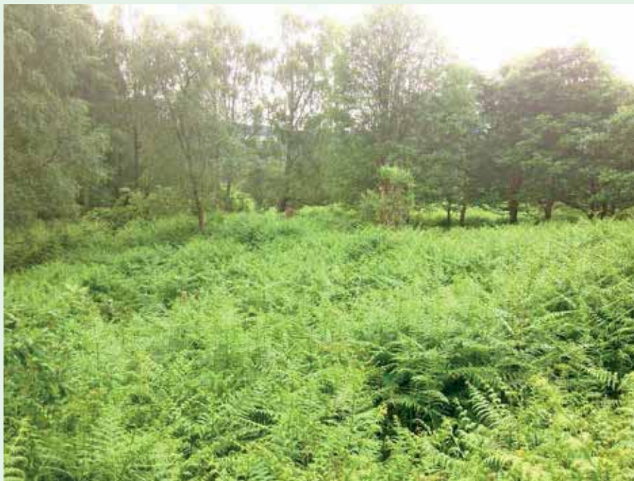
Overalt er ørnebregner et stort problem efter renafdrift eller skærmstilling.

Men i Skotland kan savværkerne ikke bruge store dimensioner af