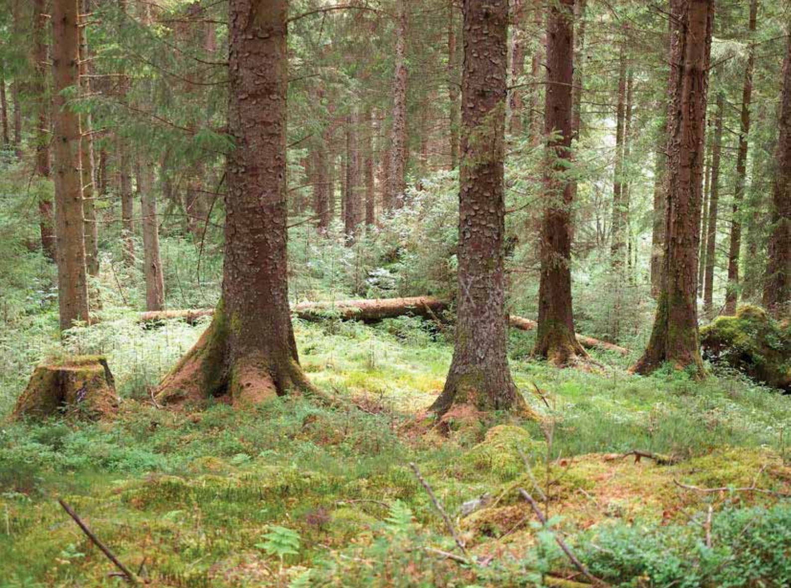
CCF i sitkabevoksning fra 1930'erne med en underetage af selvforyngelse af sitka. (South Achray Forest).