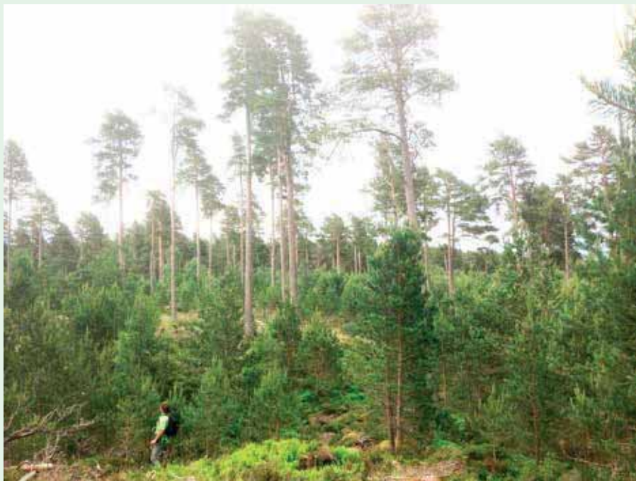
Ældre selvforyngelse af skovfyr og birk under overstandere af skovfyr fra 1862. Målet er skovfyr med islæt af birk. Suppleringsplantning med vækstkræftigere træarter ønskes ikke. (Loch Vaa Forest).

sitka. Derfor bliver sitka - i modsætning til douglas - ikke mere værdifuld af at opnå en stor dimension. Diskussionen er så om det er savværkerne der skal indrette sig efter skovbrugets lyst til at producere store dimensioner, eller om CCF systemet skal forkorte omdriften.