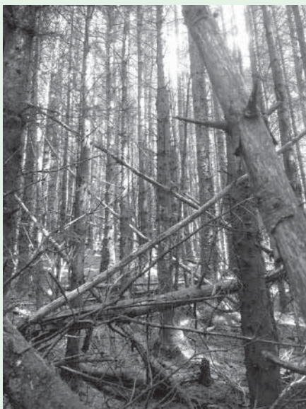
Sitka drives i regelen uden tynding. Her er stående vedmasse 790 m 3 (Ben A'an, Trossachs Forest District).

ørnebregner og alt for store vildtbestande, og derfor er der på kort sigt små muligheder for at etablere stabile toetagerede bevoksninger.